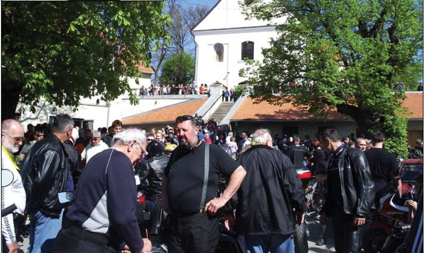
Svaka čast velečasni!