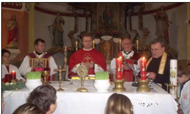
Blagdan župe svete Barbare