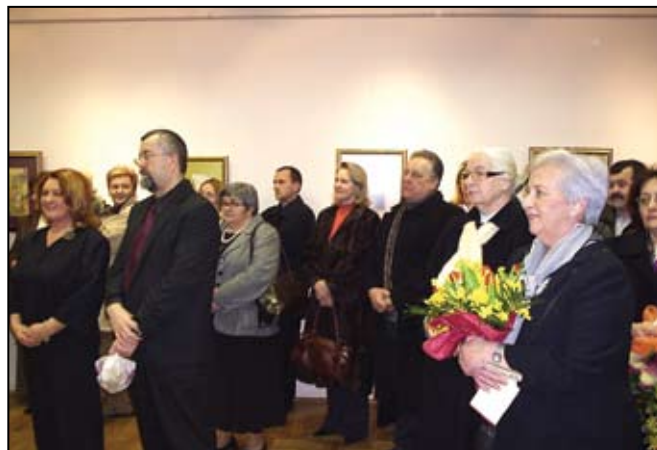
Gledajući zagorske zvonike sva su lica bila razdragana

Srednja škola Bedekovčina pokazala se odličnim domaćinom ovog iznimnog kulturnog događaja.