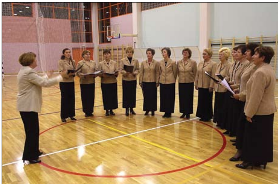
Nastup ženskog pjevačkog zbora KUD-a Bedekovčina