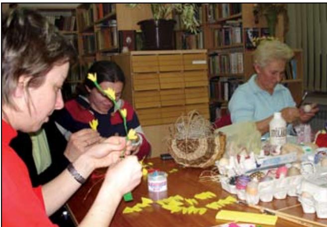
Uskršni su se ukrasi radili u Knjižnici

vrijedne žene Udruge Zlatno srce i Udruge Našeni- na su izrađivale božićne i uskršne motive koje su