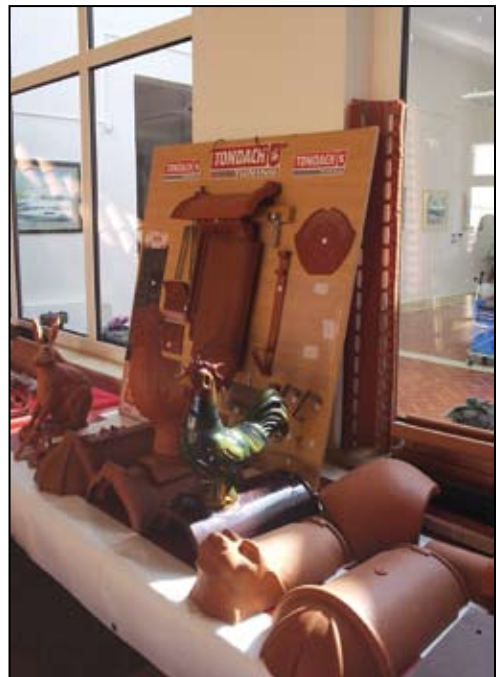
Dio proizvodnog programa Tondach

Na Skupštini dioničara 17.04.1996. god. prihvaćena je ponuda o dokapitalizaciji tvrtke. U sjedištu korporacije „Ziegelwerke Gleinstätten“ nakon toga počinje užurbana priprema i radovi na izradi planova izgradnje nove tvornice i sklapanja ugovora s dobavljačima najmodernije opreme za proizvodnju prešanog crijepa. Odlučeno je da se u toj fazi ulaganja prekine proizvodnja blok opeke koja je prije pečena u istoj peći zajedno s crijepom te da se postojeća peć preuredi isključivo za proizvodnju crijepa za koji u Bedekovčini postoje vrlo kvalitetne sirovine. Tvornica u Bedekovčini je dokapitalizirana s 30 milijuna njemačkih maraka.