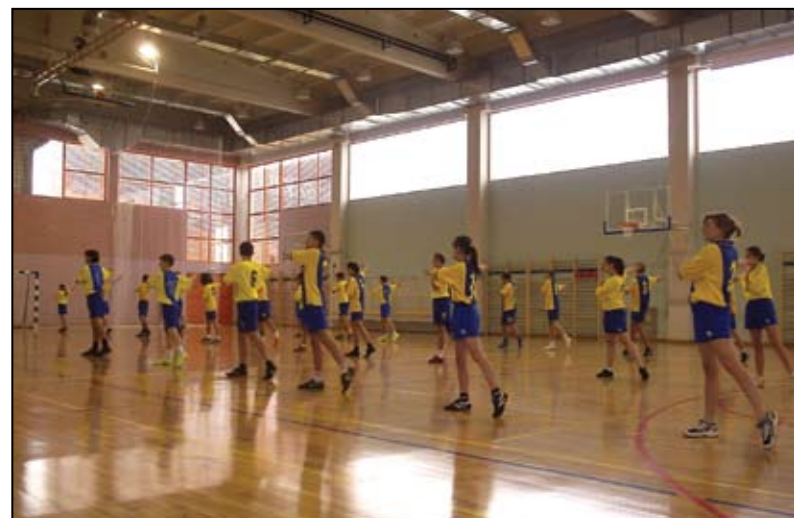
Bedekovčanski srednjoškolci odmah su iskušali dvoranu