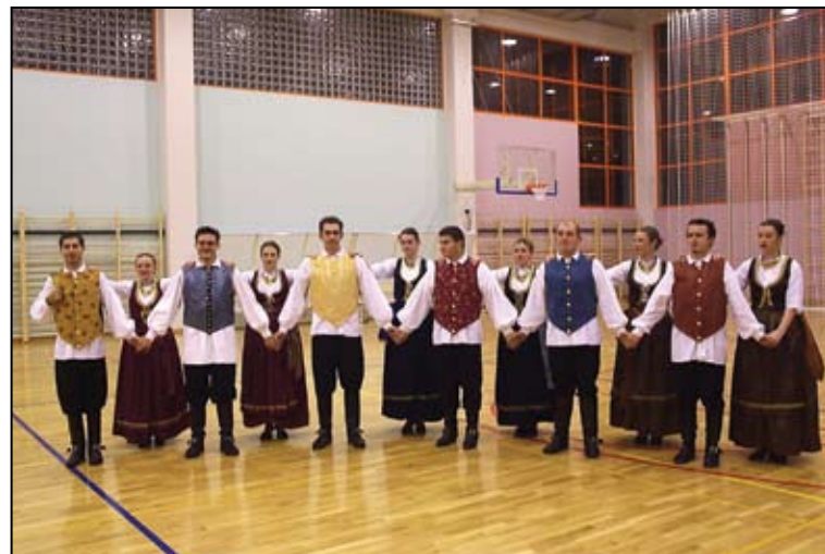
Žune su u čast dvorane otplesale Bunjevac