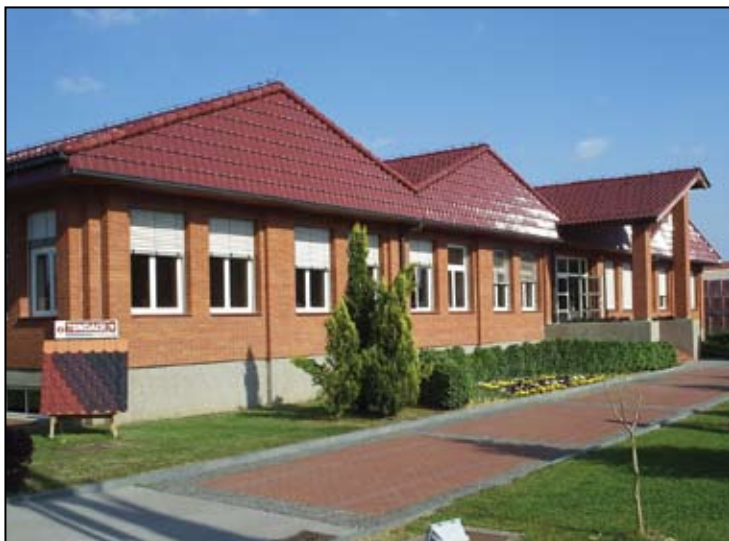
Upravna zgrada Tondach Hrvatske u Bedekovčini

Tondach Gleinstätten zapošljava u Europi više od 3.200 radnika u 34 tvornice u 10 zemalja i oslanja se na lokalni management, najmoderniju tehnologiju i inovacijsku politiku. U tu veliku grupaciju spada i Tondach Hrvatska, tvornica- kćer koja ima sjedište u Bedekovčini, a u sklopu nje djeluju tri tvornice: jedna u Bedekovčini i dvije u Đakovu. U Đakovu je upravo završena investicija od oko 20 milijuna eura što je još jedan dokaz uspješnosti ove tvrtke. „Našom novom proizvodnom linijom u Đakovu II još ćemo fleksibilnije reagirati na želje kupaca. To uključuje proizvodnju tehnički zahtjevnih sjajnih, tamnih engoba i glazura bez dodatnih problema“ – kaže KR Franz Olbrich, predsjednik Uprave Tondach Gleinstätten d.d. „Tondach je pozitivno ocijenio potražnju na hrvatskom tržištu i očekuje se dugoročni daljnji porast prodaje“, kaže Mladen Koprak, dipl.ecc., direktor Tondach Hrvatska d.d.