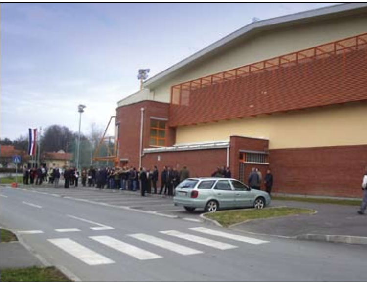
Športska ljepotica se otvara

Kako je bilo i najavljeno, ministar znanosti, prosvjete i športa Dragan Primorac, koji je u Bedekovčini stigao sa svojim suradnicima, svečano je otvorio novoizgrađenu školsko – mjesnu športsku dvoranu.