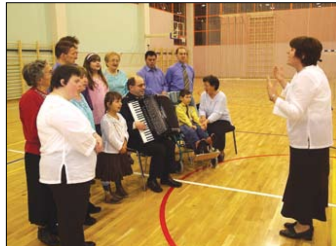
Oduševili su članovi Udruge invalida