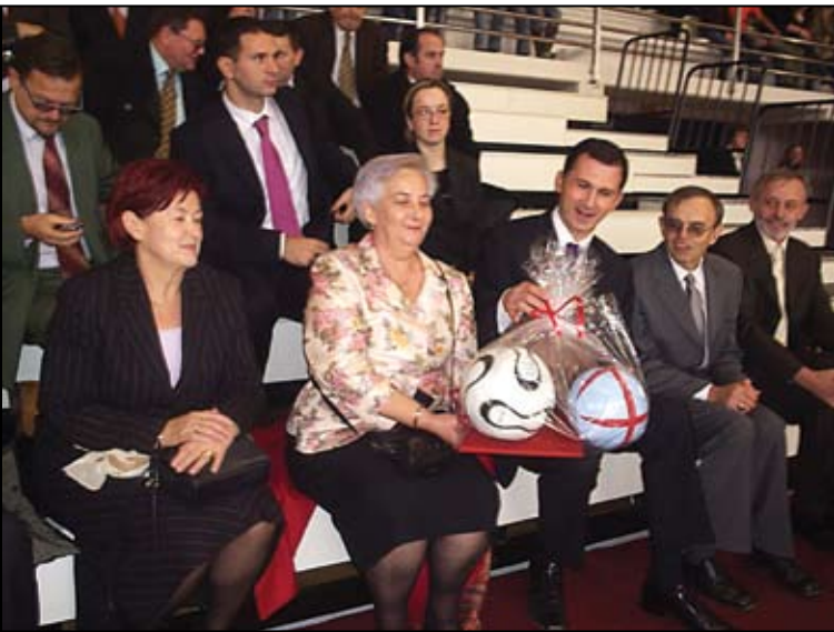
Županica Vlasta Hubicki je donijela tri lopte

Kako je bilo i najavljeno, ministar znanosti, prosvjete i športa Dragan Primorac, koji je u Bedekovčini stigao sa svojim suradnicima, svečano je otvorio novoizgrađenu školsko – mjesnu športsku dvoranu.