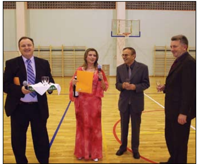
Šampanjac za novu dvoranu!

Tek nekoliko dana nakon svečanosti otvaranja novoizgrađene školsko – mjesne športske dvorane u nju su pohrlili mještani i članovi svih udruga na području općine kako bi bili sudionici ili promatrači do sada najvećeg i najposjećenijeg koncerta, uz to održanog u, za Bedekovčane, najljepšoj dvorani na svijetu. Nastupili su mnogi, a slike govore više od riječi.