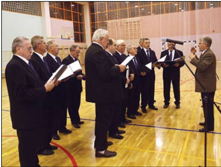
Nastupio je i Muški pjevački zbor Magdalenić