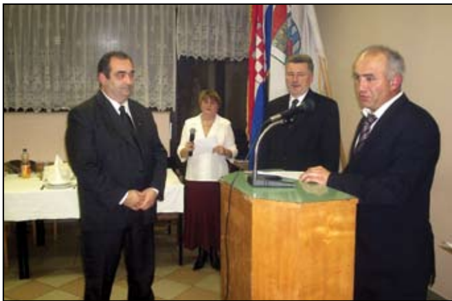
Na svečanoj sjednici su dodjeljena i priznanja