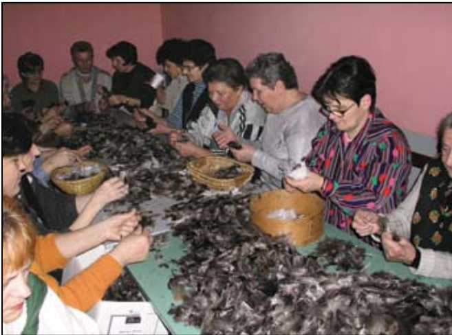
Peročeha u Bedekovčini

Od posljednjeg do ovog broja Bedekovčanskog GLASNIKA puno se toga dogodilo na području općine Bedekovčina. Prošli smo kroz božićno, korizmeno i uskršno vrijeme, a upravo u to doba godine održavaju se brojni susreti. Tako su se naši građani družili na peročehama u Brestovcu i Bedekovčini,