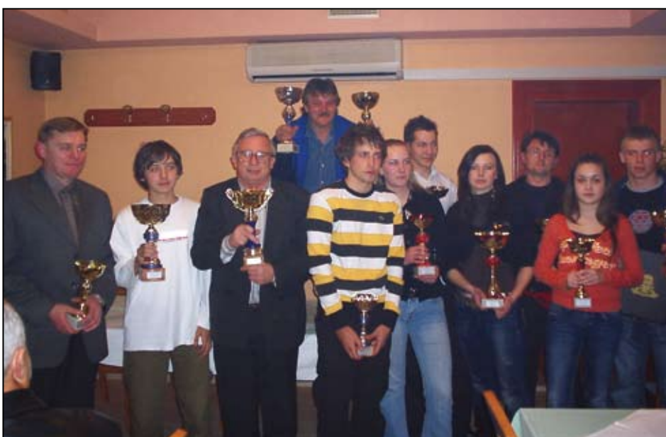
Svi nagrađeni bedekovčanski športaši