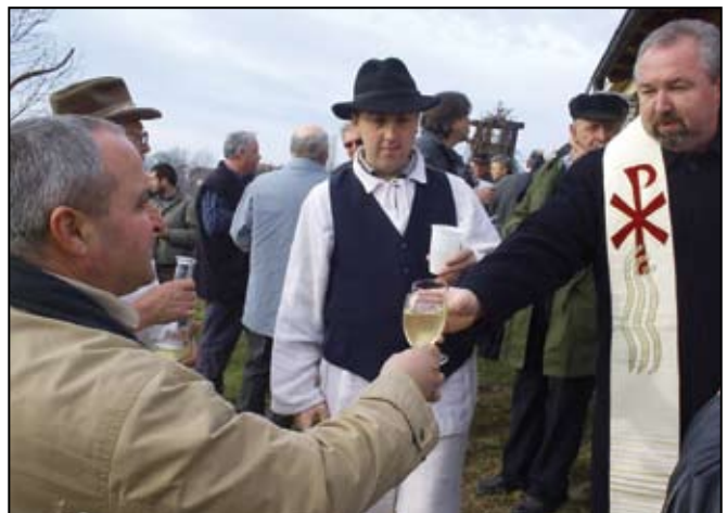
Vincekovo u Orehovici

brinu se o jezerima, športaši uredno treniraju i daju sve od sebe za što bolje rezultate... Samo za nabranje trebao bi nam cijeli jedan GLASNIK pa ćemo samo dio tih događanja ilustrirati.