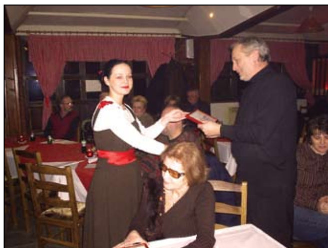
Podjela zahvalnica Žuna za put u Ameriku