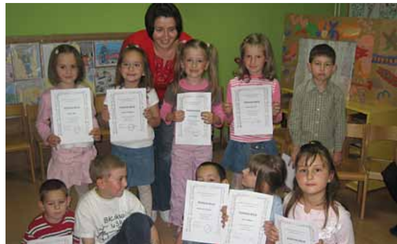
"Mali Englezi" dobili pohvalnice

Dječji vrtić Bedekovčina već tri godine organizira i samostalno provodi "Program ranog učenja stranog jezika" kroz Englesku igraonicu koju polaze djeca iz vrtića i predškole, a interes je svake godine sve veći.