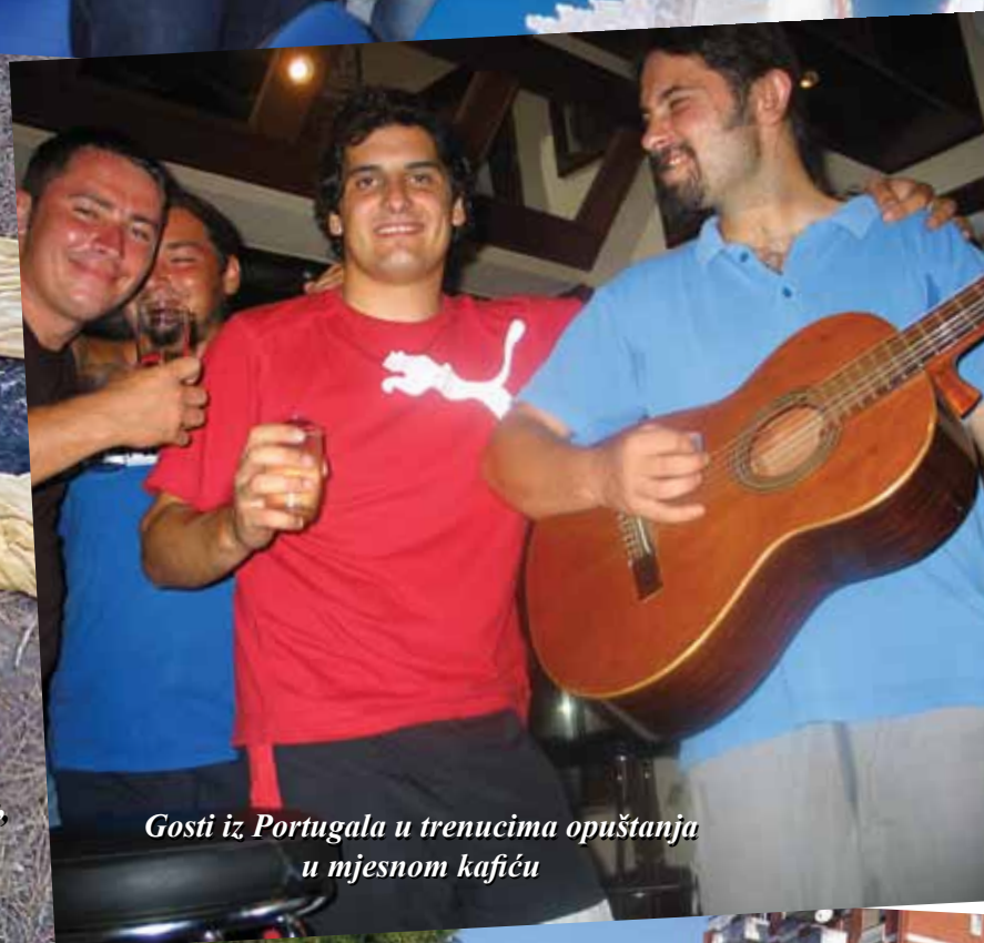
Gosti iz Portugala u trenucima opuštanja u mjesnom kafiću