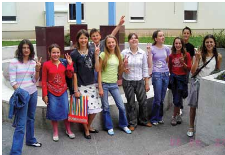
1. MJESTO - "ZNAM, HOĆU, MOGU", KRAPINA 2007. (za scenski prikaz "sudnice", pripremljen uz vlastiti tekst)

Ukratko, puno smo radili i učili, družili se i igrali, bili vrijedni i veseli. Zaradili smo nagrade, priznanja, pokale, medalje, dobre ocjene, zelenu zastavu. Izradili puuuuuno plakata, zidnih novina,