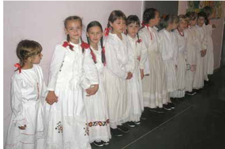
Najmlađe članice FA ŽUNA

zveselili publiku dječjim igrama i pjesmicama dok je ona malo starija grupa izvela zagorske plesove. Folklorna skupina pokazala je svoje vrhunsko pje-