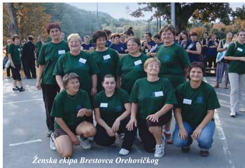
Ženska ekipa Brestovca Orehovičkog