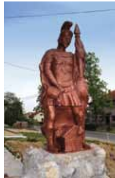
Kip sv. Florijana

4. svibnja ispred DVD-a Bedekovčina održana je sveta misa povodom Dana sv. Florijana,