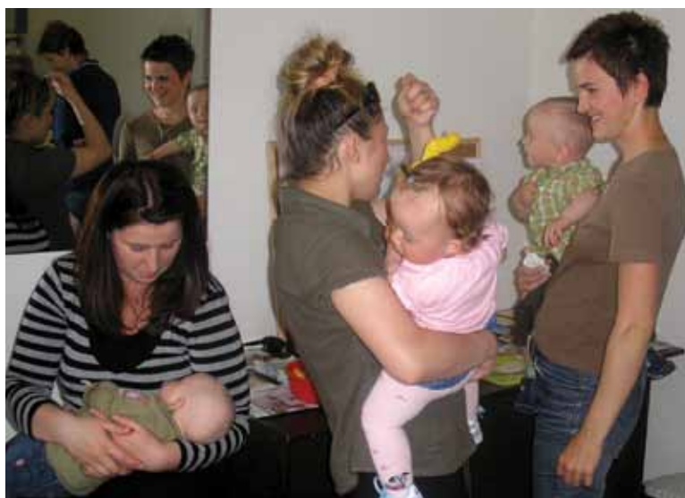
Grupa za potporu dojenja „Majčin dar“