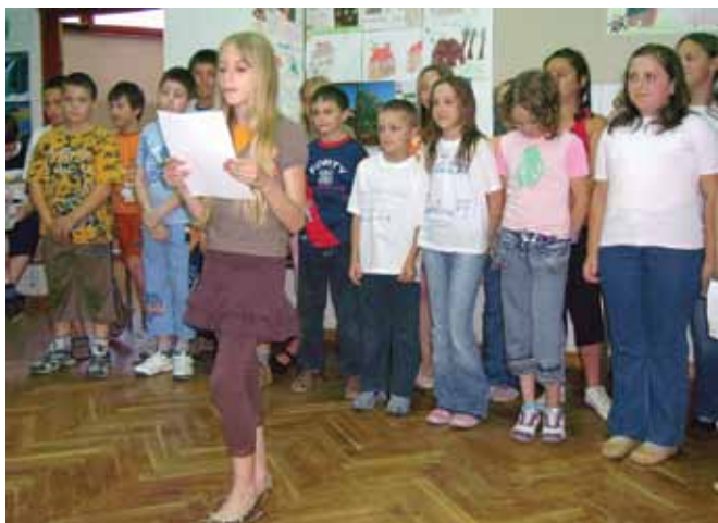
Učenici razredne nastave

predstavili su se kao razred koji može sve kad se svi učenici dobro organiziraju. Tijekom izvođenja programa prisjetili su se svih lijepih i šaljivih trenutaka, izleta, učenja pisanja, čitanja i računanja. Zajedničko druženje završilo je uz smijeh, sok, grickalice i razgovor. Tijekom školske godine učenici su proučavali različite krajeve Hrvatske: Park