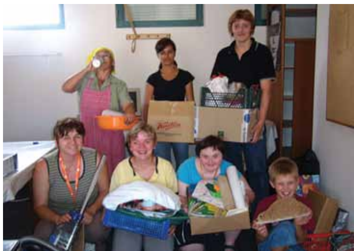
21. kolovoza akcija preseljenja pokretnog inventara u prostorije nasuprot željezničke stanice

Udruga invalida Bedekovčina osnovana je 28. travnja 2000. g. s ciljem poboljšanja odnosa društva prema invalidnim osobama te kako bi se invalidne osobe bolje uključile u život mjesta. Nakon osnivanja Udruzi je dodijeljena prostorija za rad na drugom katu tržnice u Bedekovčini, a 21. kolovoza započelo je i preseljenje u nove prostorije.