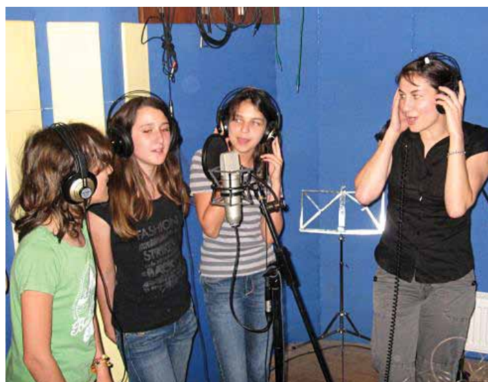
Snimanje eko himne OŠ Bedekovčina