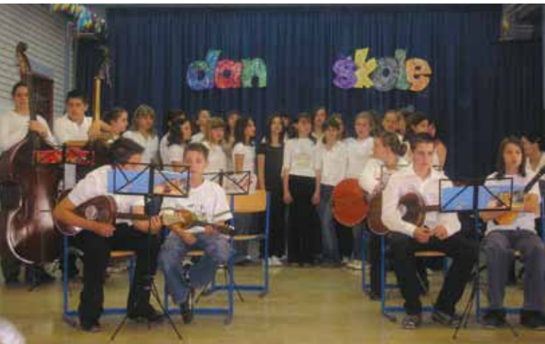
Proslava dana škole

Redovito sudjelovanje na županijskim natjecanjima donosi sve više rezultata i uspjeha osnovnoškolaca. Ovogodišnji rezultati doista su impresivni, a odraz su kontinuiranog rada učenika i njihovih učitelja.