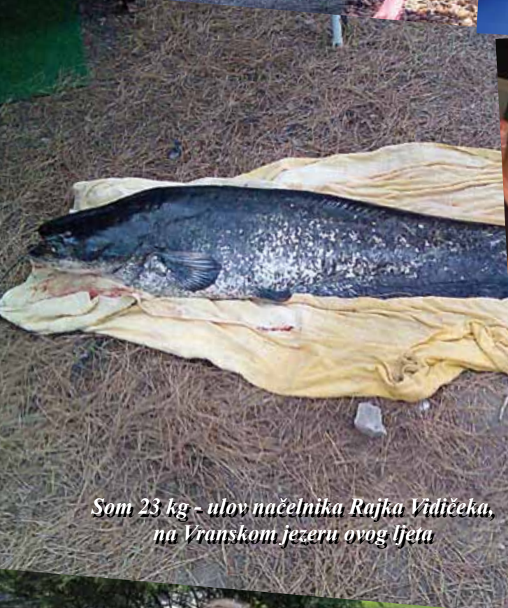
Som 23 kg - ulov načelnika Rajka Vidičeka, na Vranskom jezeru ovog ljeta