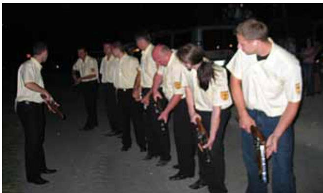
Kuburaško društvo "Ban Josip Jelačić" iz Zaprešića

paljenjem Ivanjskog kri- jesa te nastupom kuburaškog društva "Ban Josip Jelačić" iz Zaprešića koji su svojim kuburama i topom "razbudi- li" okupljene. Odlična pred- stava KUD-a "Žensko ka- zalište" iz Gornjeg Jesenja oduševila je gledatelje svo-