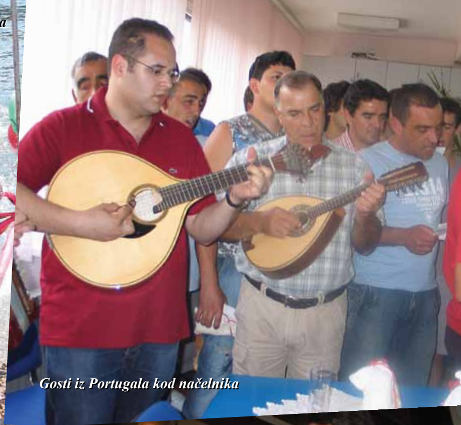
Gosti iz Portugala kod načelnika