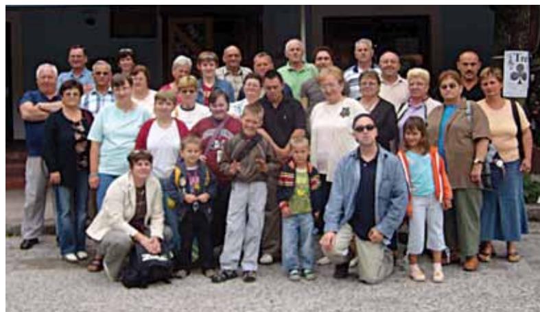
Udruga invalida na izletu

Ciljevi Udruge usmjereni su na uključivanje invalidnih osoba u sve oblike društvenih aktivnosti u mjestu, razvoj i unapređenje pozitivne interakcije između članova Udruge i društvene zajednice, pojačan rad s osobama s mentalnom retardacijom, zatim socijalno – humanitarne aktivnosti, poticanje izričite obveze društvene zajednice na svim razinama za stvaranje materijalnih preduvjeta za rad i djelovanje Udruge. Do sada se Udruga profilirala djelovanjem kroz tri kluba: