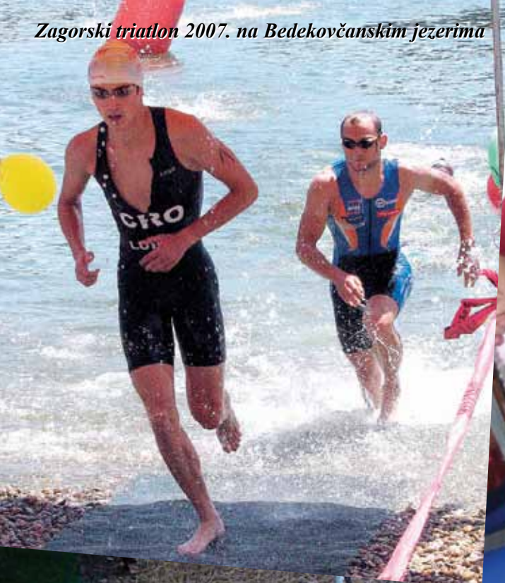
Zagorski triatlon 2007. na Bedekovčanskim jezerima