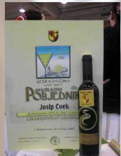
Apsolutni pobjednik Josip Cvek

“S obzirom da je ovo prvi put da su udruge organizirale Sajam, smatram da je u načelu ispunjena svrha Sajma koja je bila zamišljena, mislim na sadržaje prvog dana i stručna predavanja. Same diplome i zlatne medalje potvrđuju da su naša vina u Zagorju u sve većem usponu. Ima nekoliko sitnica koje bi trebalo u budućnosti popraviti, prvenstveno vezano uz promidžbene aktivnosti, ali u načelu nemam veće kritike. Naša je udruga na Vinarijadi 2007. imala 16 zлата, neka od tih vina su išla na ovaj Sajam, a ovdje smo dobili 1 zlato, 5 srebrnih medalja, bronce i jedno priznanje. Zadovoljni smo jer su metode ocjenjivanja ovdje bile drugačije i kvalitetnije što je samo potvrdilo naše zlato od ranije.”