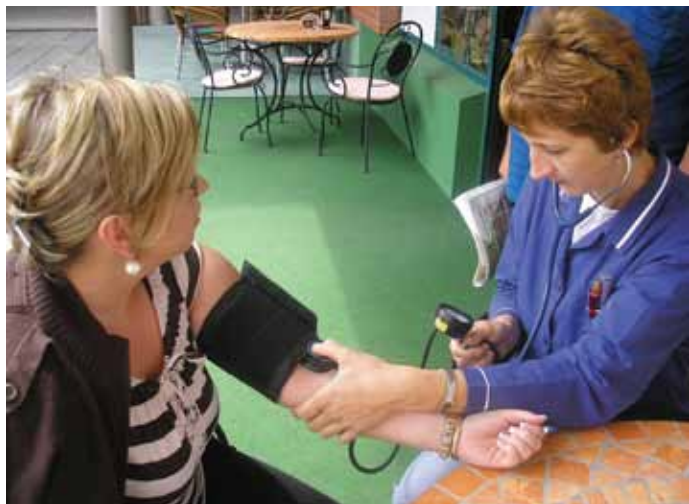
Akcija mjerenja tlaka i šećera povodom 20. godišnjice ambulante Bedekovčina