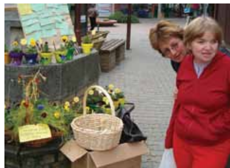
Izložbeni radovi Udruge invalida

U svakom sljedećem broju Bedekovčanskog glasnika predstaviti ćemo Vam jednu ili više udruga koje djeluju na području Općine Bedekovčina. U ovom broju saznajte o vrijednoj udruzi koja je svojim radom privukla pažnju svih mještana.