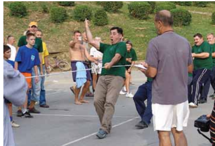
Muška ekipa Brestovca Orehovičkog

i za žensku ekipu koji su se u konačnici zbrajali. Prema bodovnim rezultatima 1. je mjesto u sveukupnom poretku osvojio Brestovec Orehovički.