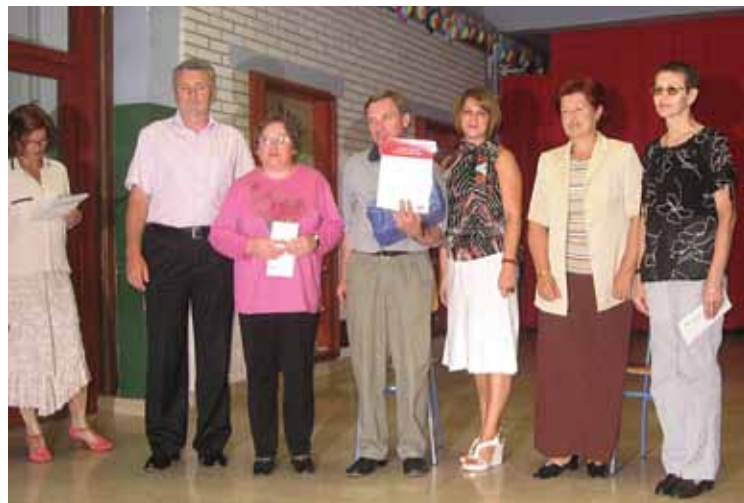
Nagrađeni sudionici manifestacije

Zatvaranjem manifestacije načelnik Općine je proglasio otvoren natječaj za Susret riječi 2008. g.