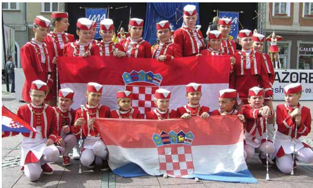
Bedekovčanske mažoretkinje na Europskom prvenstvu 2007. mažoretkinja Opole – Poljska