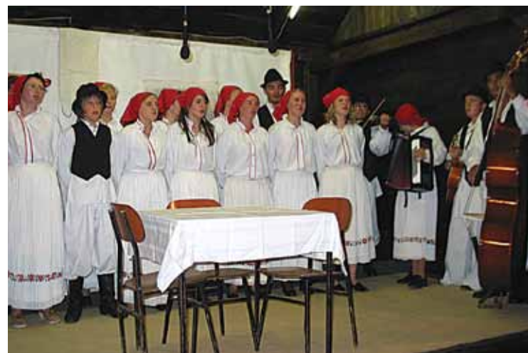
KUD "Žensko kazalište" iz Gornjeg Jesenja