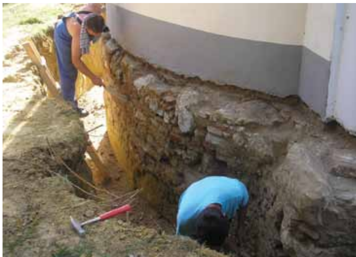
Odkopavanje višestoljetnih temelja crkve sv. Barbare radi izrade drenaže