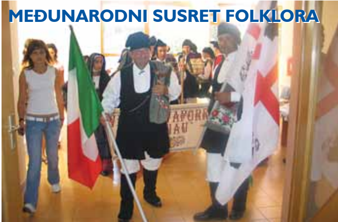
Folklorni ansambl iz Sardinije

Vrativši se doma s turneje po Portugalu, članovi FA ŽUNA nisu se odmarali, već su organizirali Međunarodni festival 26. kolovoza u Bedekovčini okupivši Folklorne ansamble iz Sardinije, Mađarske i Portugala. Uz njih su nastupili i folkloriši iz Mača i naravno Žune. Gosti iz Portugala bili su smješteni u Bedekovčini pa su imali prilike za njezino upozna-