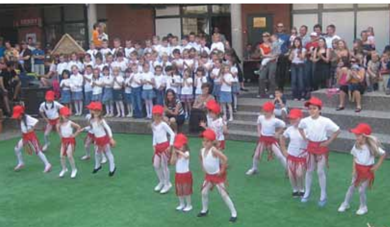
Ritmika DND-a Bedekovčina

Lijepo nedjeljno poslijepodne proteklo je u ugodnom druženju i zanimljivoj priredbi. Djeca su od DND-a Bedekovčina dobila osvježanje u vidu sokova i sladoleda.