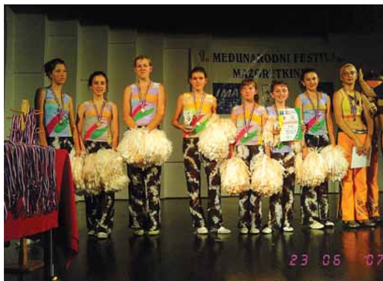
3. MJESTO NA MEĐUNARODNOM FESTIVALU MAŽORETKINJA (Nakon samo 5 mjeseci vježbanja naše cure su otplesale za broncu!)

krasnih likovnih radova. Napisali pregršt kreativnih sastavaka, stvorili novi broj školskog lista "Kokotiček", pripremili i proveli terenske nastave, te-