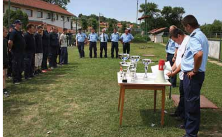
VIII Općinsko natjecanje vatrogasaca, vatrogasne mladeži i djece

U organizaciji vatrogasne zajednice Općine Bedekovčina organizirano je VIII. Općinsko natjecanje vatrogasaca, vatrogasne mladeži i djece 1. srpnja u Bedekovčini.